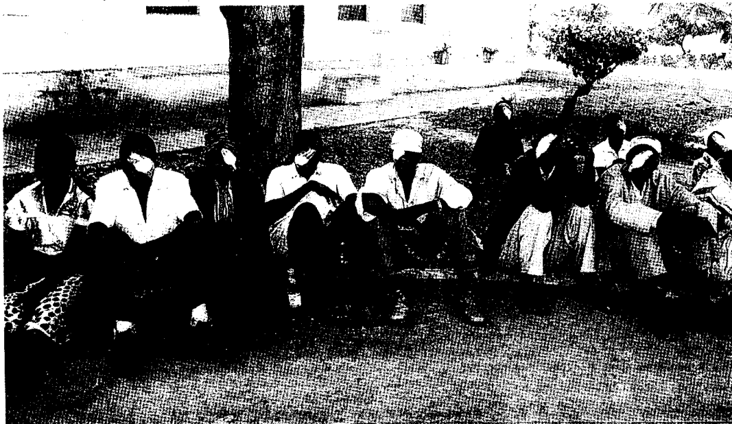
Un grupo de mozambiqueños aguarda a ser atendido por el equipo médico que colabora con la fundación Ojos del Mundo.

Un equipo de oftalmólogos del Hospital Donostia colabora con la fundación Ojos del Mundo para mejorar la salud ocular en Mozambique